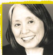
Jean Shinoda Bolen

gisch begreifbar. Ihre zeitliche Entwicklung folgt keinen streng determinierten Gesetzen, sondern nur noch gewissen Tendenzen / Erwartungen, charakterisiert durch Wahrscheinlichkeiten für mögliche Realisierungen, die, im statistischen Mittel, zu unserer gewohnten Vorstellung der Welt als einer objektivierbaren Realität mit ihren strengen Gesetzen führt.