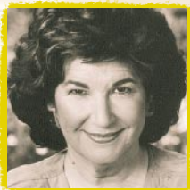
Candace B. Pert

Grenzen des Todes hinaus. Sie werden synchronistische, übersinnliche oder mystische Erfahrungen genannt. In diesem Vortrag liegt die Betonung auf den psychospirituellen Aspekten von Unity in Duality.