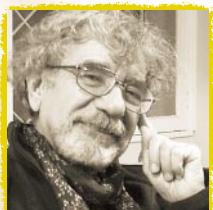
Humberto Maturana Romesin

Das Gehirn, die Drüsen, das Immun- und Verdauungssystem usw. enthalten mindestens 200 sog. Neuropeptide, Hormone oder Immuno-peptide. Sie kommunizieren aus der Entfernung mittels Zelloberflächenrezeptoren und bilden dabei überall im Bodymind ein psychosomatisches Netz-