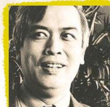
Trinh Xuan Thuan

Einheit und Dualität sind Unterscheidungen, die wir Menschen im Bereich unserer Handlungen machen. Gleichzeitig sind Dualität und Einheit Unterscheidungen, die wir im Bereich unserer Erfahrungen machen. Sie haben Folgen für unser spirituelles Leben, weil sie uns einen Pfad eröffnen, der uns entweder zu Glück und Wohlergehen oder zu Leid führt, je nach der Art und Weise, wie wir sie leben: wenn wir die Dualitäten als Gegensätze ausleben, erschaffen wir Leid in unserem Leben und im Leben anderer. Der Vortrag weist darauf hin, dass der Pfad, der uns von diesem Leid befreit, der Pfad ist, auf dem wir in der Einheit von Geist und Handlung, in der Gegenwart leben, auf dem wir alle Anhaftung an Sicherheit loslassen - das ist der Pfad der Biologie der Liebe.